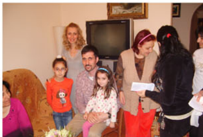
Во время проекта в Армении я стал свидетелем покаяния многих людей.

В августе этого года, после нескольких месяцев молитв и предварительных консультаций я присоединился к служению миссии «Международное Поручение». Эта миссионерская организация начала своё служение 40 лет назад по инициативе одного дьякона баптисткой церкви в штате Техас, и изначально оно было направлено только на благовестие в Мексике. Однако со временем Господь расширил пределы служения, и сейчас оно совершается в 153 странах мира. Но в эту миссию я вступил не из-за масштабов её служения, а из-за ориентированности её служения на поместные церкви. Думаю, что именно этого нам часто не хватало, когда шла речь о сотрудничестве наших церквей с зарубежными миссиями. Кроме того, я считаю, что организация подобных проектов межцерковного благовестия является лучшей формой для осуществления краткосрочных миссий в нашей стране.