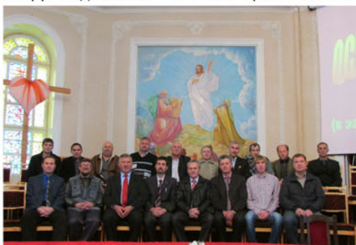
После встречи с пасторами церквей ХМАО, г. Сургут.