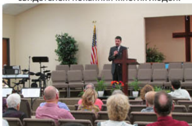
Рассказываю о служении в России в одной из церквей штата Техас.