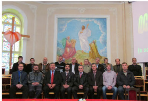
После встречи с пасторами церквей ХМАО, г. Сургут.

Как приятно было осознавать, что наши церкви ещё полны людьми, которые готовы переживать не только о своих близких, но ещё ехать к дальним, чтобы и им указать путь к Богу и в поместную церковь. В Псковской области я встретился с одним братом из Украины, который, несмотря на свои 65 лет, приехал в этот регион в составе команды, чтобы помочь местным верующим в благовестии. До его уверования в Господа большинство окружающих знало его больше по тюремной кличке «Лёнька Пантелеев» и обращалось к нему в основном для помощи в криминальных разборках, так как он имел статус «вора в законе». За свой относительно небольшой тюремный стаж (11 лет) он как-то смог высоко подняться в уголовном мире и даже принять участие в кровавом бунте. Глядя на этого простого жизнерадостного дедушку с бородой и в очках, весело беседующим с сестрами на кухне, я никогда бы не подумал, что этот брат имел такое бурное прошлое. В составе той команды были и сестры, и в качестве мобильной группы из шести человек они смогли за 7 дней провести 82 встречи с неверующими людьми, и стали свидетелями многих покаяний. И я искренно рад, что теперь имею возможность помогать таким людям приезжать в другие церкви и там помогать поддерживать верующих в служении.