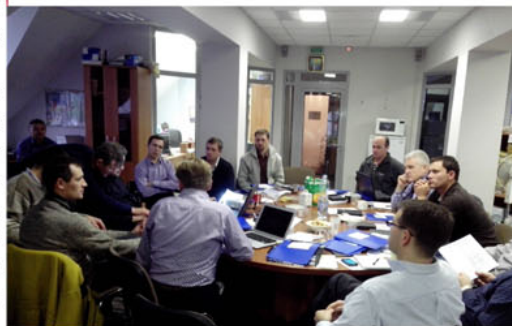
Совещание координаторов миссионерского служения в Москве. В синих папках — описание нашего проекта.

Сейчас, когда год приближается к своему концу, я провожу много времени в поездках, рассказываю о проекте и ищу добровольцев на краткосрочные миссии. Таким образом, сейчас формируется график служений на следующий год, но окончательное слово — за Господом. Готовлюсь посетить Ржев и Кимры (Тверская область), Минск и Черновцы (Украина) в течение ближайших 2-3 недель.